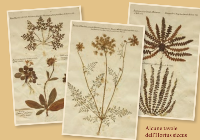
Alcune tavole dell' Hortus siccus

Per i visitatori di Frutti antichi, ingresso ridotto €. 3,50